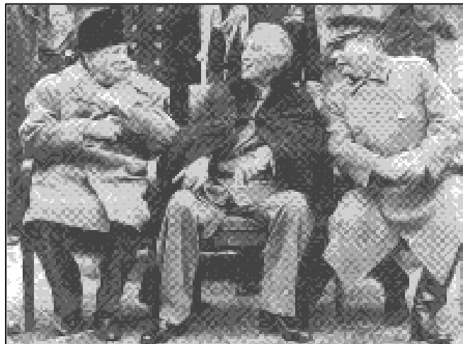
Der Gipfel von Jalta im Februar 1945 beendet den Zweiten Weltkrieg: Churchill, Roosevelt, Stalin teilen Europa auf.

So wurde auch der Europagedanke in Osteuropa zu dieser Zeit weitgehend unterdrückt. Westeuropa wurde von den Kommunisten als dekadent dargestellt; sie beschworen ihrerseits eine neue, osteuropäische, vor allem panslawische Brüderlichkeit. Erst die raue Wirklichkeit der Sowjetifizierung schuf unter der osteuropäischen Bevölkerung eine Assoziation des Kommunismus mit der Sowjetunion und ihrer historischen Tradition des Absolutismus, der Orthodoxie (nun auf ideologischem Gebiet) und Brutalität. Daher wohnte den Erhebungen gegen den Kommunismus auch ein anderes Ziel inne: eine Rückkehr nach Europa und seinen Werten, in erster Linie zur Demokratie und zum Humanismus.