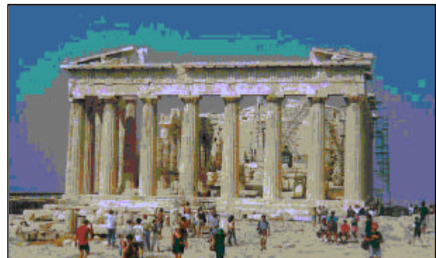
Der Parthenon-Tempel auf der Akropolis, Symbol des alten Hellas

Die innere Struktur eines Stadtstaats (Polis) zeichnete sich durch Machtausgleich und verbrieftes Selbstbestimmungsrechte aus. Diese Struktur wirkte im europäischen Städtewesen ebenso fort wie in den politischen Strukturen späterer Gesellschaften. Die geringe Größe der politischen Einheiten erlaubte die Beteiligung breiter Schichten an der Willensbildung. Die Menschen begannen, sich Gedanken über Fragen wie Gerechtigkeit zu machen und entwickelten gesellschaftliche Grundwerte wie beispielsweise den Schutz schwächerer Glieder des Gemeinwesens . Die Natur des Menschen und die gerechte Staatsführung wurden zu Hauptthemen griechischer Philosophie. Der sich entwickelnde Gegensatz zwischen Volk und Adel führte zu einer verstärkten Beteiligung des Volks an den Entscheidungen über die Belange des Gemeinwesens und förderte in der Folge die Entwicklung des Rechtsstaates.